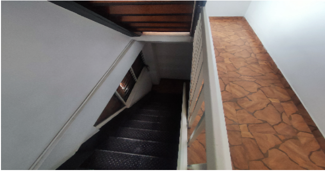
Escalera común - CJ