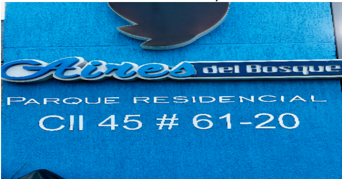
Nomenclatura del Conjunto