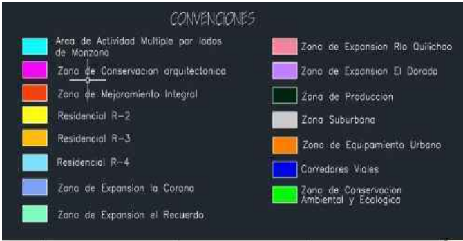
EDIFICIO GRUPO SECTOR GRUPO SECTOR GRUPO SECTOR AREA DE CONSOLIDACION R.3 AREA DE CONSOLIDACION EDIFICATORIA R.3 Respon GR 3 90 60 24 00 Area urbana consolidada con algunas vacas , se plantea su densificación y consolidación arquitectónica.