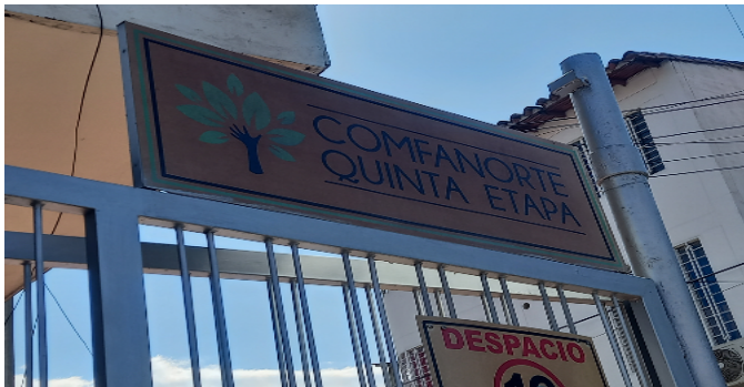
NOMBRE DE LA URBANIZACION