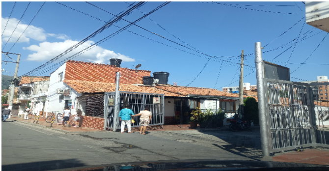
ACCESO A LA URBANIZACION