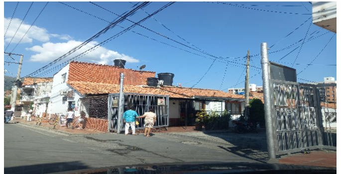
ACCESO A LA URBANIZACION