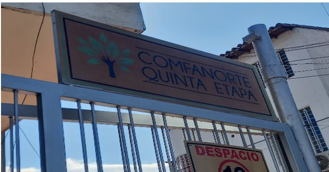
NOMBRE DE LA URBANIZACION