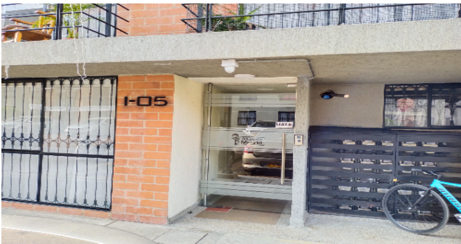
Entrada a la torre