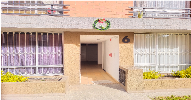
Entrada a la torre