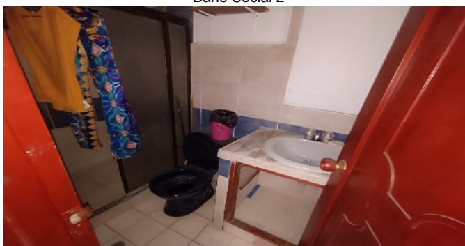
Baño Social 2