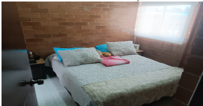
Hab. 1 o Habitación Principal