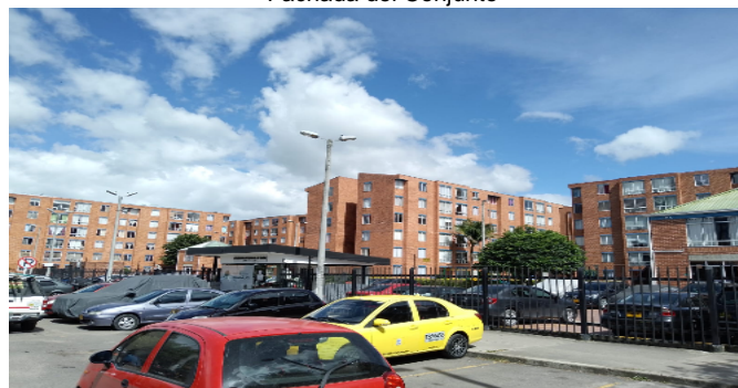
Fachada del Conjunto