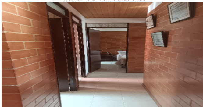
Hall o Estar de Habitaciones