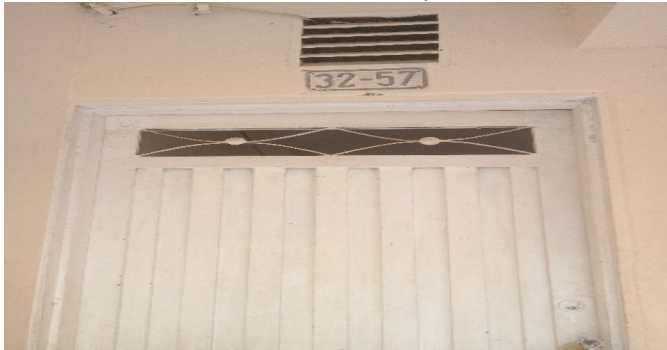
Nomenclatura del Conjunto