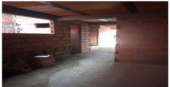
Hall o Estar de Habitaciones