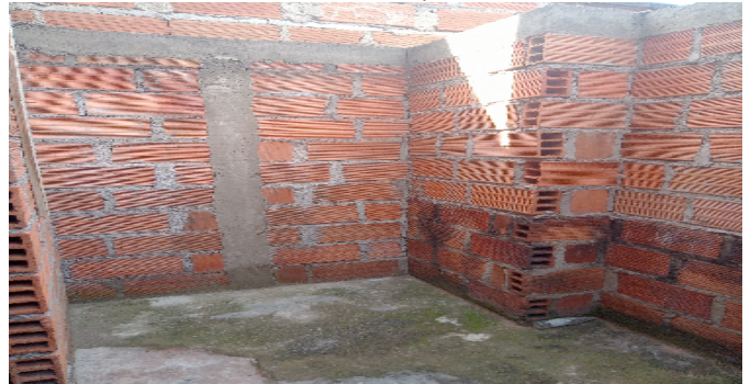
Zona de Ropas