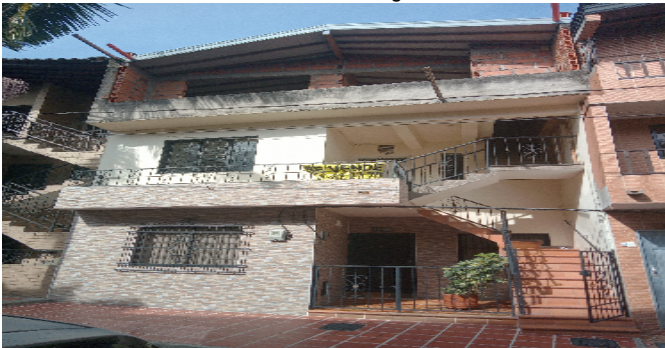
Contador de Agua