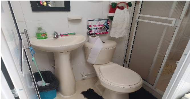
Ba1o Social Nivel 2