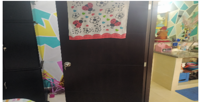
Habitaci3n 3 Nivel 2