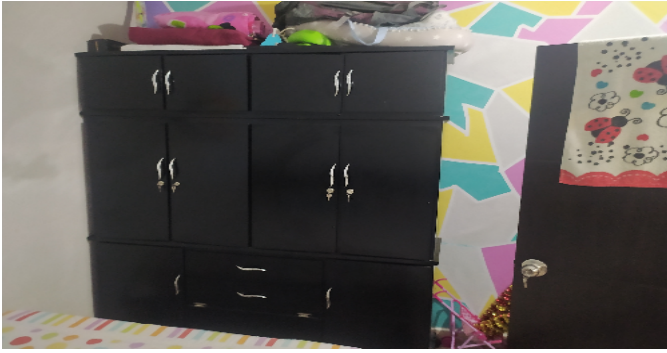
Habitaci3n 3 Nivel 2