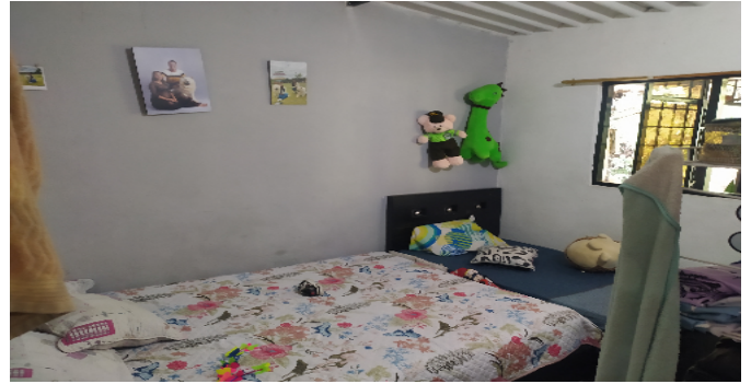
Habitaci3n Principal Nivel 2