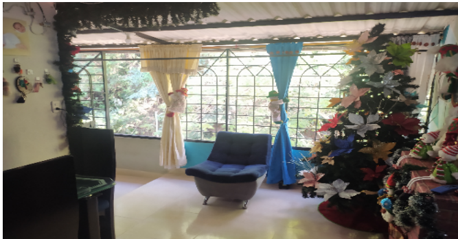
Comedor Nivel 2