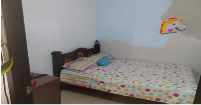
Habitaci3n 2 Nivel 2