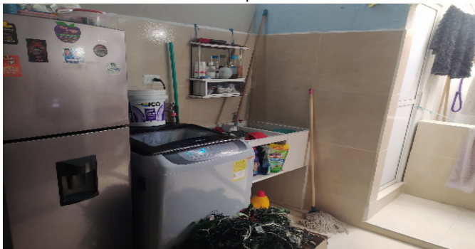
Zona de Ropas Nivel 2