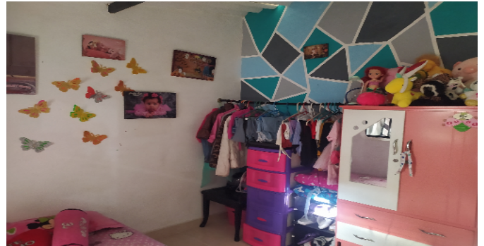
Habitaci3n 2 Nivel 2