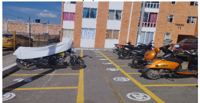
Garajes para motos-CJ