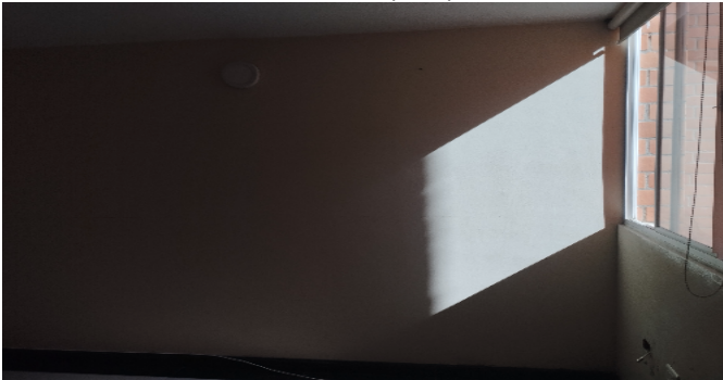
Puerta Hab. principal