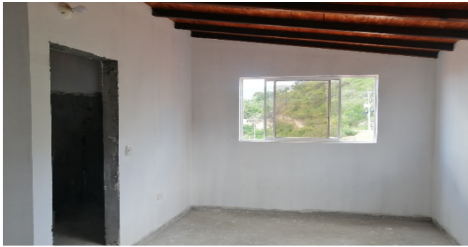
Habitación - Altillo