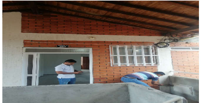
Acceso al apartamento