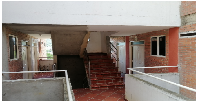
Punto fijo - Escaleras