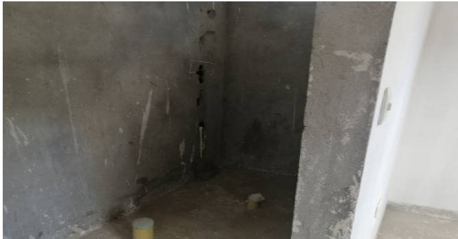
Baño privado - Altillo