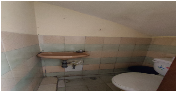
Baño Social 3