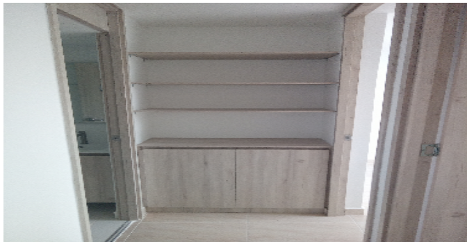
Hall o Estar de Habitaciones