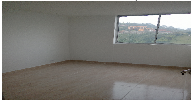
Hab 1 o Habitación Principal