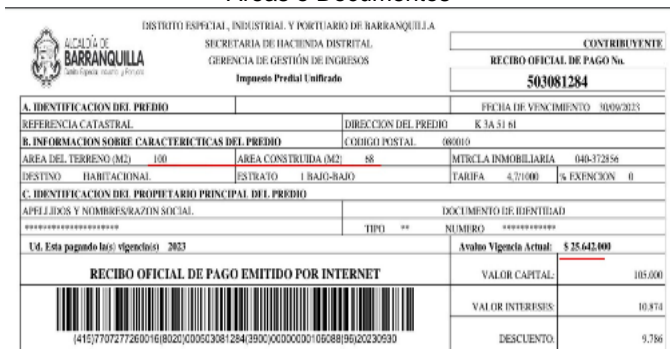
Áreas o Documentos