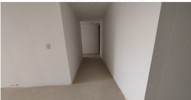
Hall o Estar de Habitaciones