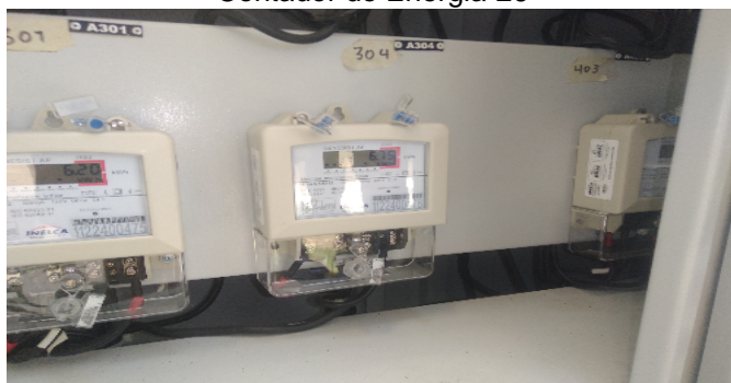
Contador de Energia-26