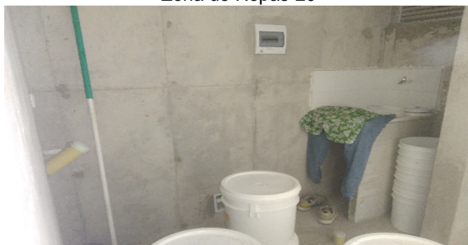
Zona de Ropas-20