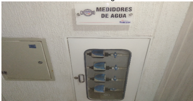
Contador de Agua-27