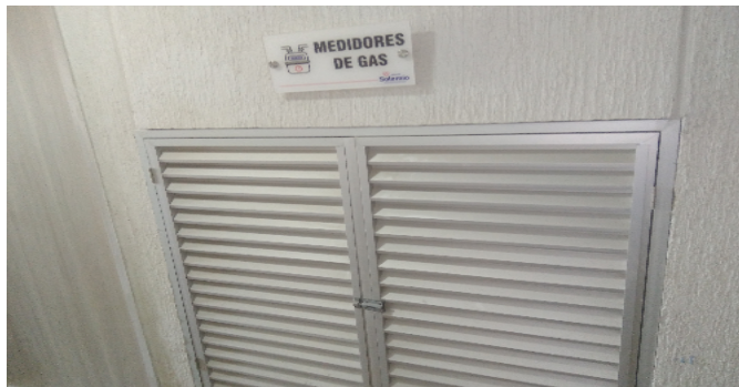
Contador de Gas-28