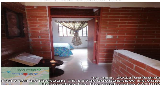
Hall o Estar de Habitaciones