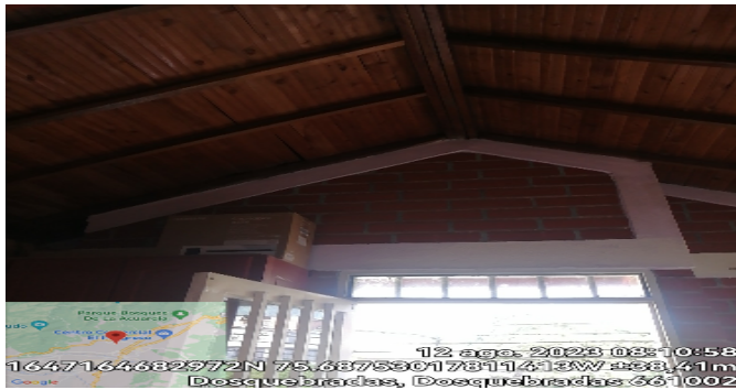
Detalle de acabados