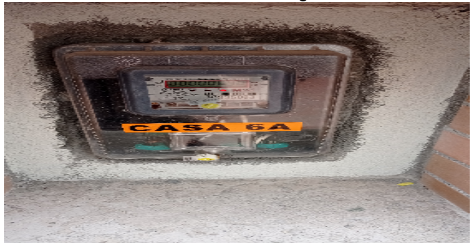
Contador de Energia