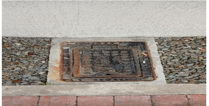
Contador de Agua