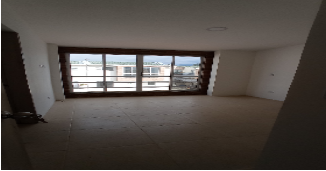
Hab 1 o Habitación Principal