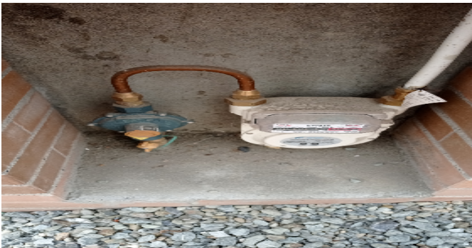
Contador de Gas