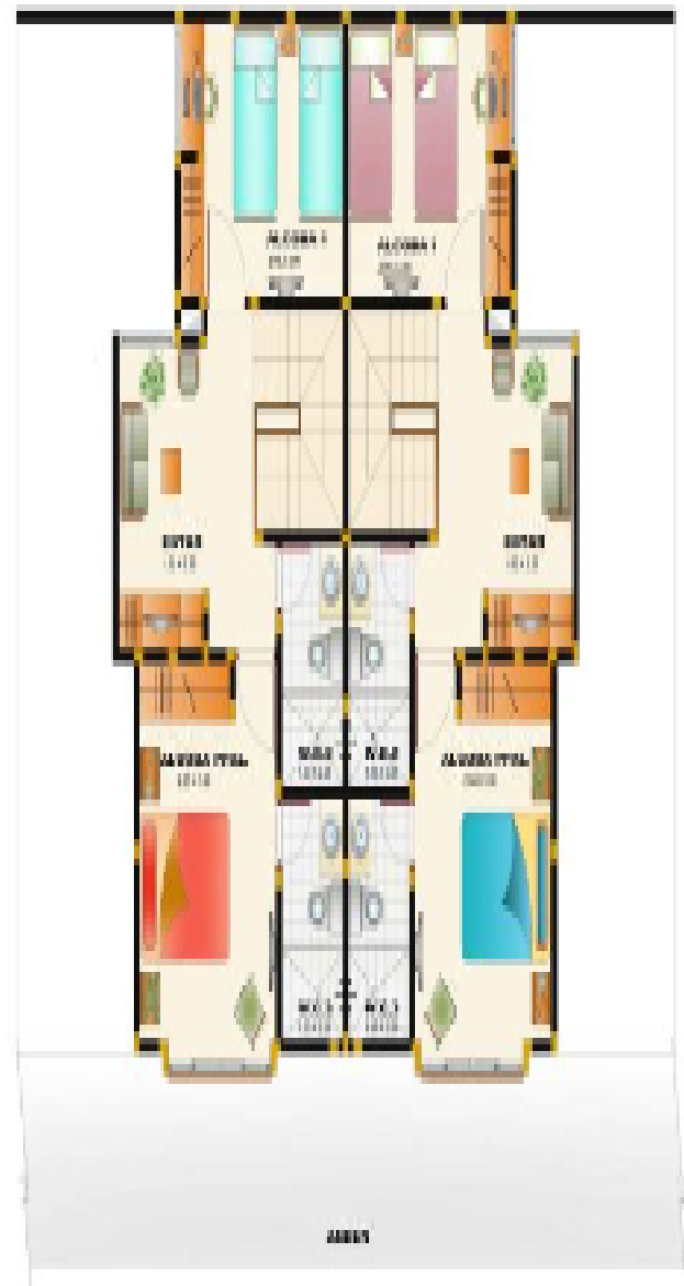
SEGUNDO PISO - AREA 43.10 M2