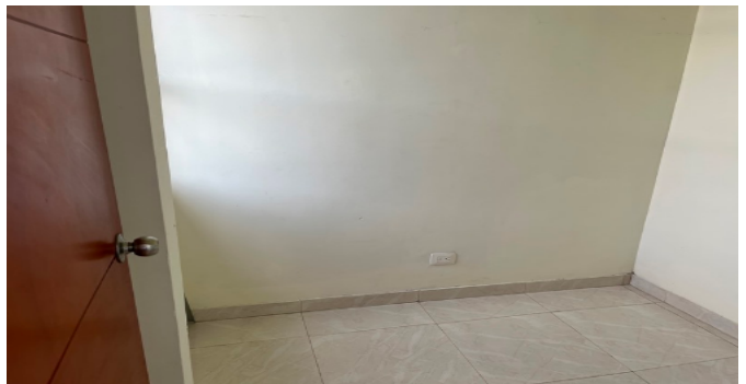
Habitación de Servicio