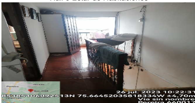
Hall o Estar de Habitaciones