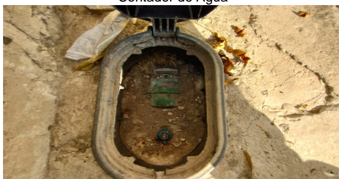
Contador de Agua