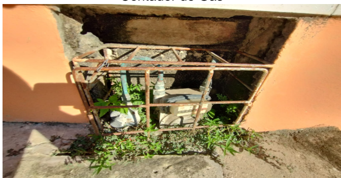
Contador de Gas