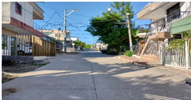
Vía frente al inmueble