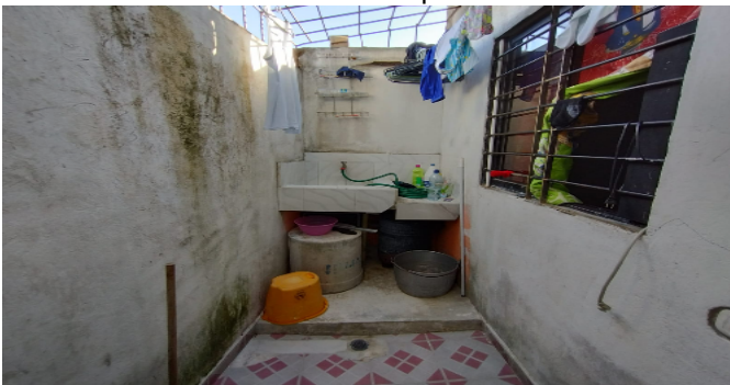
Zona de Ropas