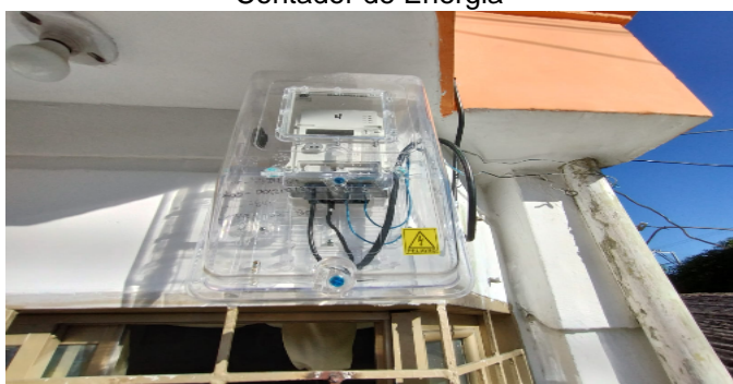
Contador de Energia