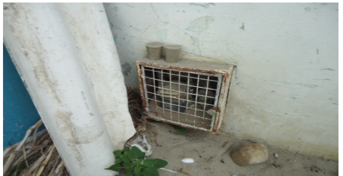
CONTADOR DE GAS CS 5