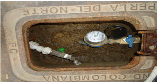
CONTADOR DE AGUA CS 5