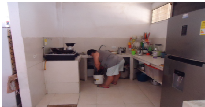
COCINA CS 2