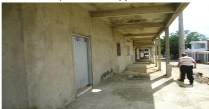
ZONA LATERAL CUBIERTA