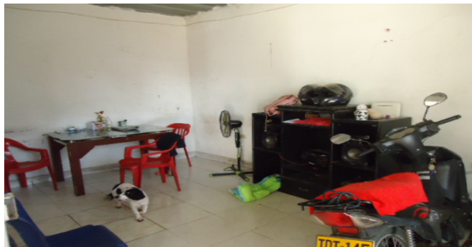
SALACOMEDOR CASA 1