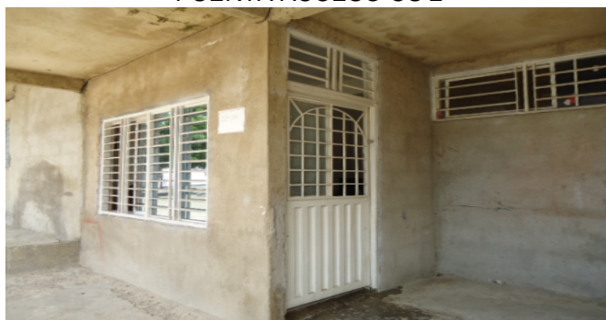
PUERTA ACCESO CS 2