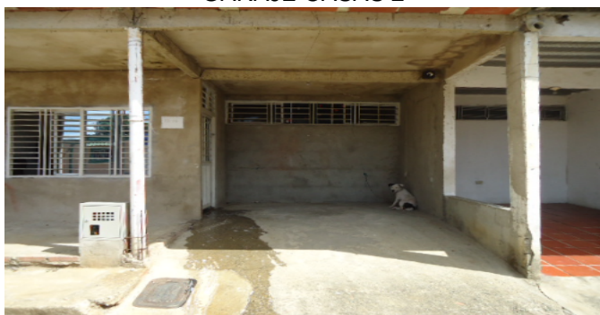
GARAJE CASAS 2