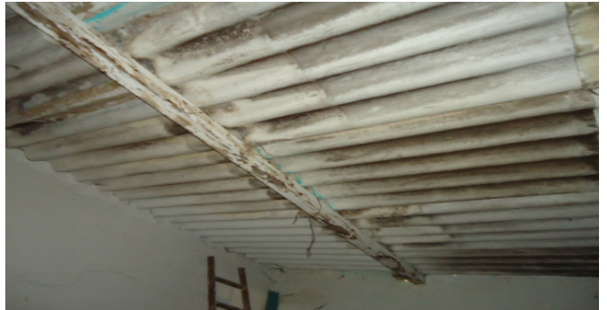
DETALLE DE CUBIERTA CS 5