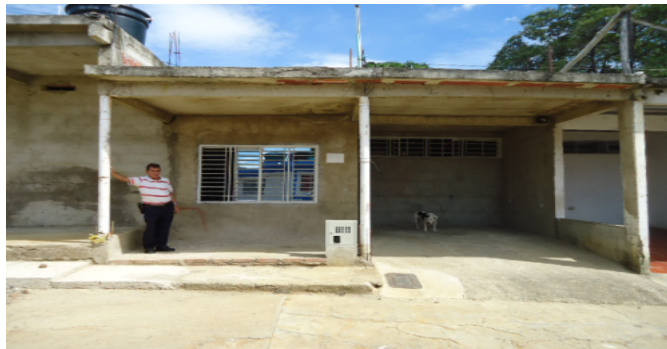
FACHADA CASA 2