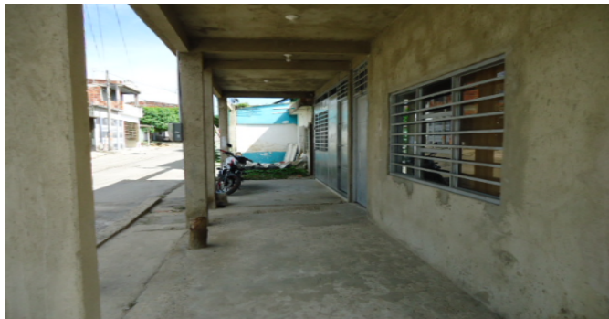
ZONA ANTERIOR CUBIERTA