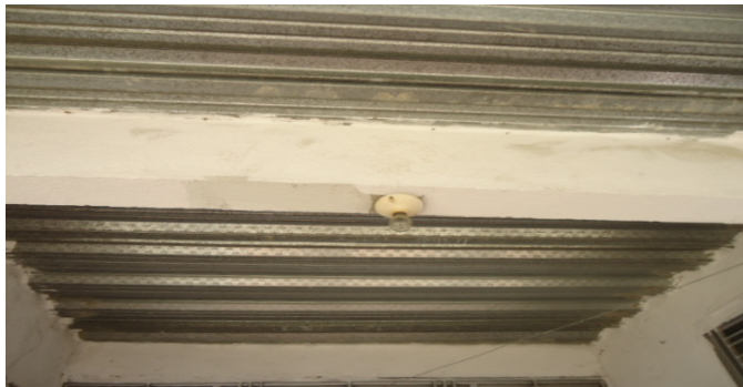
DETALLE DE CUBIERTA CS 1