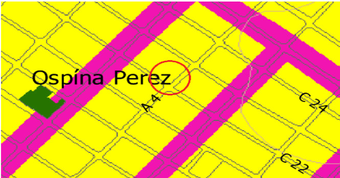
Plano Uso de suelo