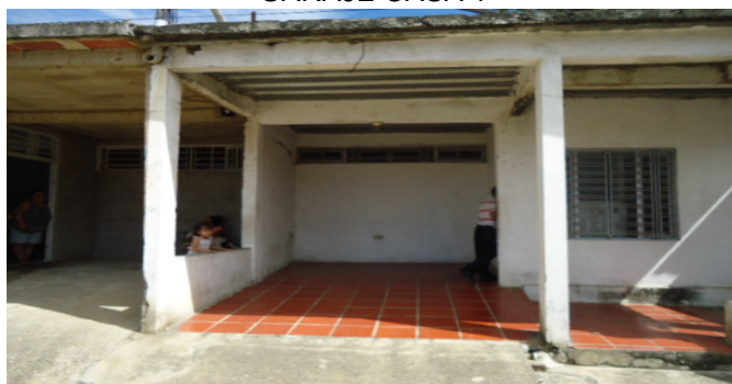
GARAJE CASA 1