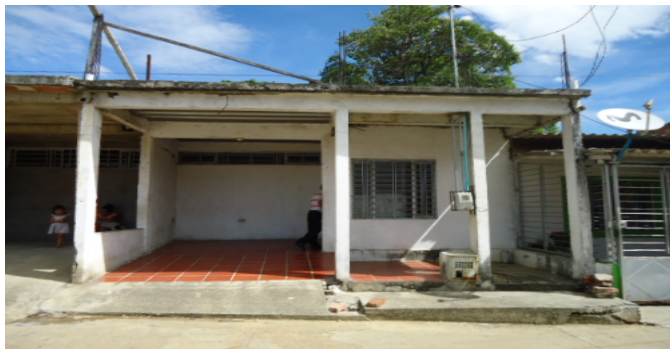
FACHADA CASA 1