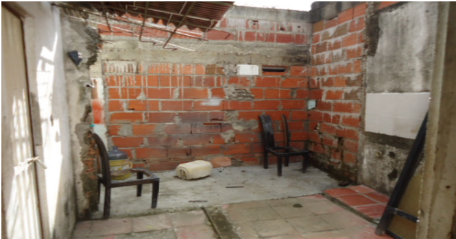
PATIO POSTERIOR CS 5