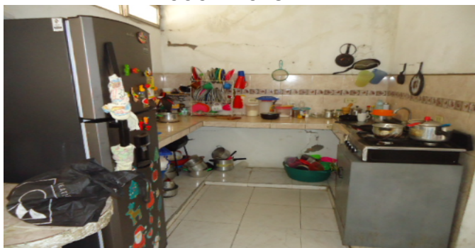
COCINA CASA 1