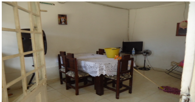
SALACOMEDOR CS 2