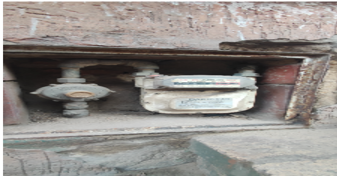
Contador de Gas