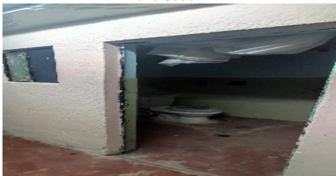
Baño Social 1