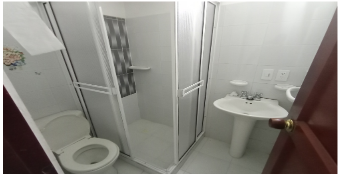
Baño Social 2