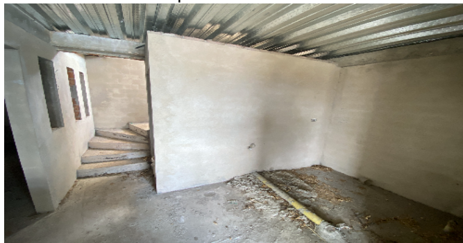
Baño privado habitacion 3