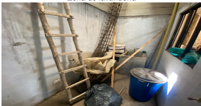
Zona de lavandería