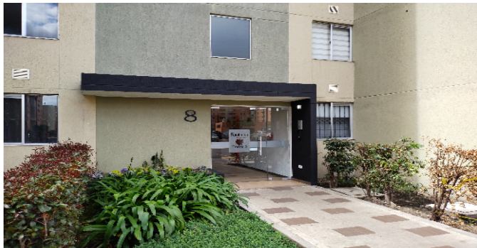
Entrada a la torre