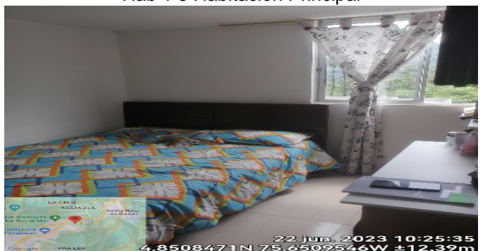
Hab 1 o Habitación Principal