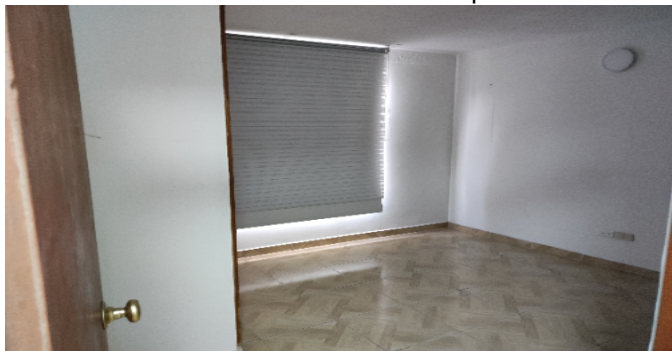
Hab 1 o Habitación Principal