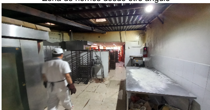
Zona de hornos desde otro angulo