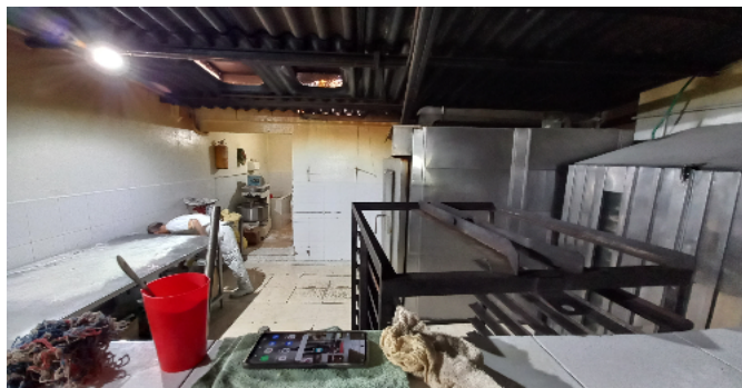
Zona de hornos