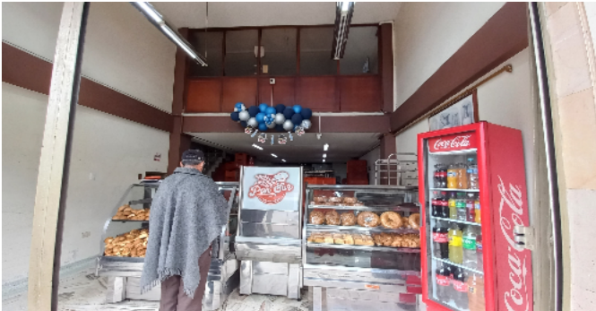
Vista interna del Local