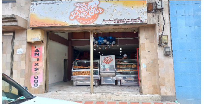
Fachada de Local Comercial