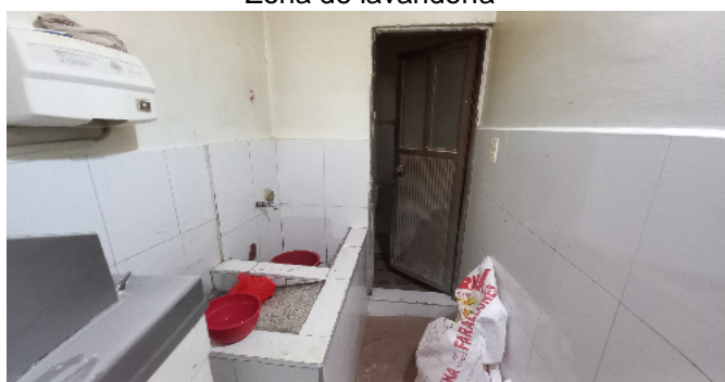
Zona de lavandería