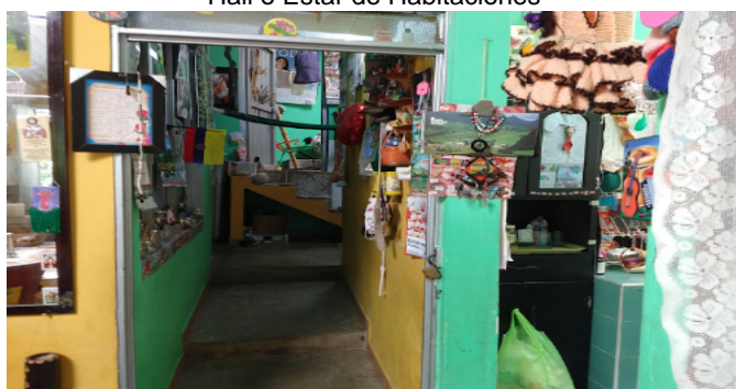
Hall o Estar de Habitaciones