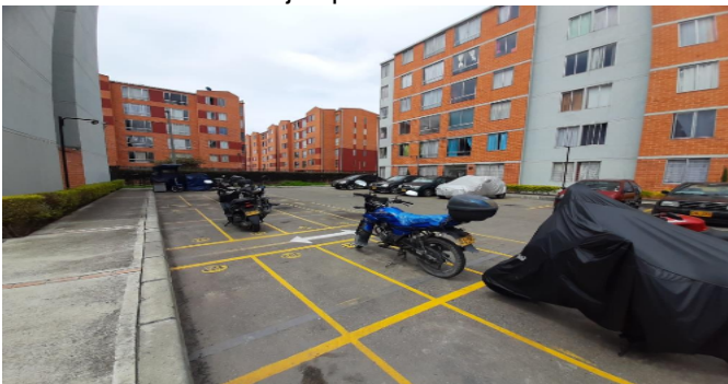
Garajes para motosCJ