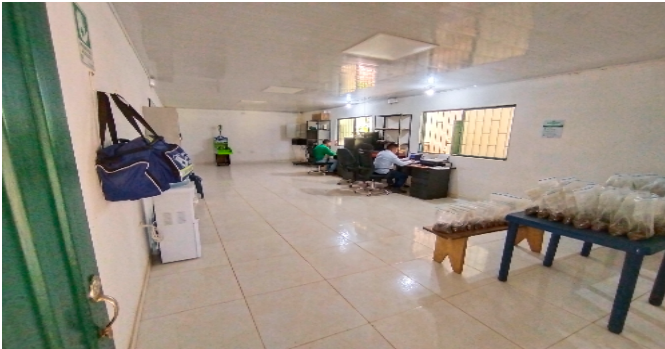
1 Zona administrativa oficina