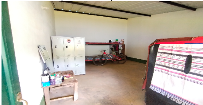
4 campamento de operarios alcoba