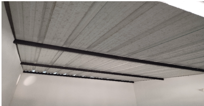
1 Zona administrativa acabados