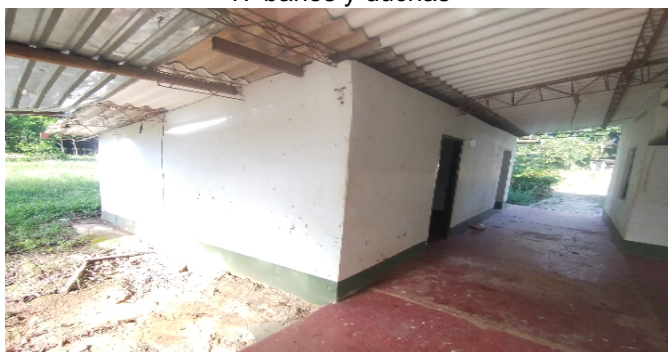
17 baños y duchas