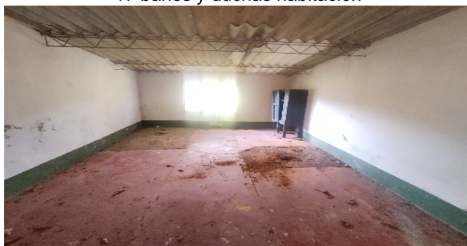
17 baños y duchas habitación