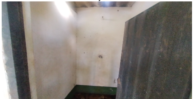
17 baños y duchas