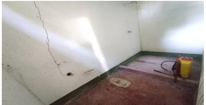
19 habitaciones admón baño