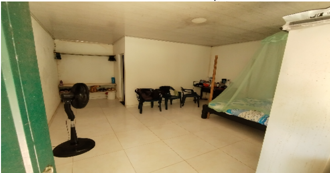
1 Zona administrativa alcoba para visitante