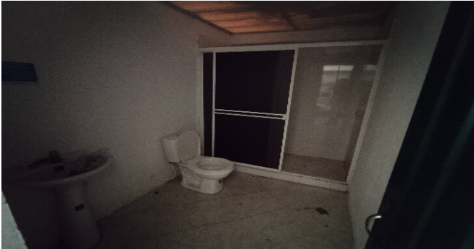
5 Bodega y taller Baño