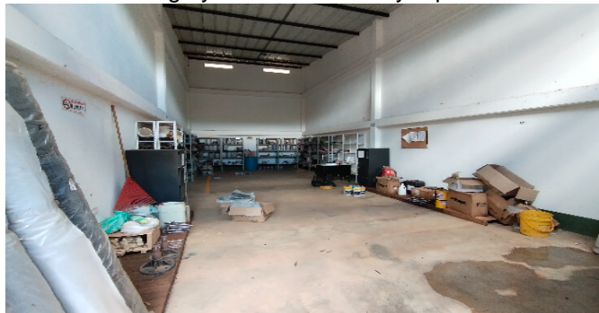
5 Bodega y taller materiales y repuestos