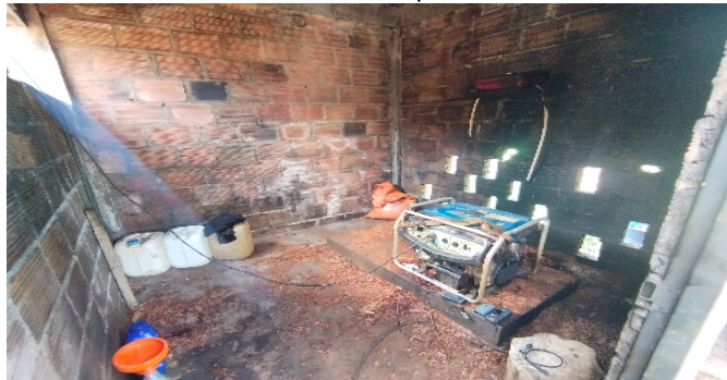
12 cuarto de planta