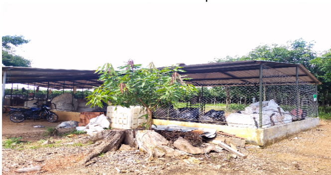
7 centro de acopio