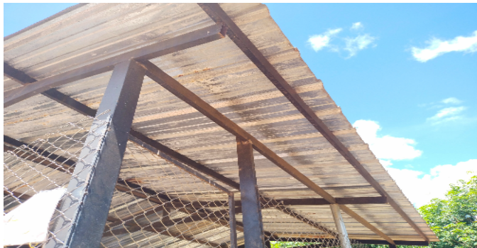
6 cerramientos a media altura