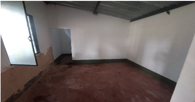
19 habitaciones admón