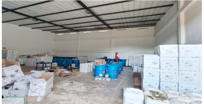
5 Bodega y taller insumos