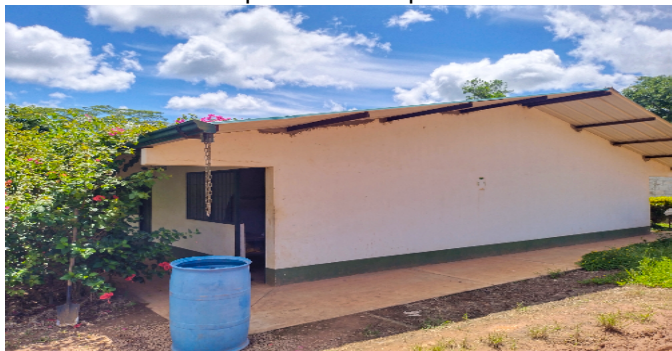
4 campamento de operarios