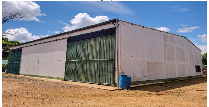
5 Bodega y taller