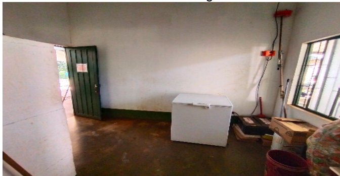
2 cocina bodega