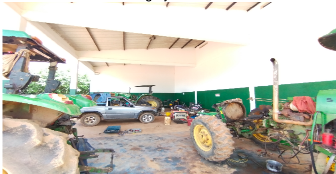
5 Bodega y taller taller