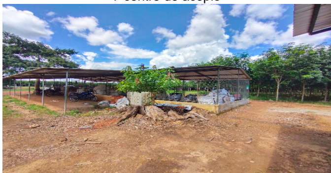
7 centro de acopio