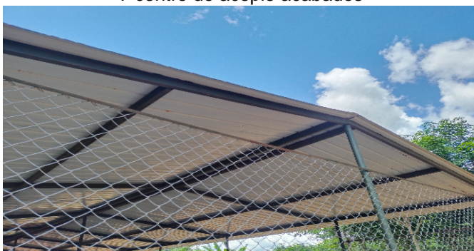
7 centro de acopio acabados