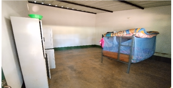
1 Zona administrativa alcoba para líder