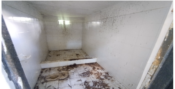
18 zona de cocina