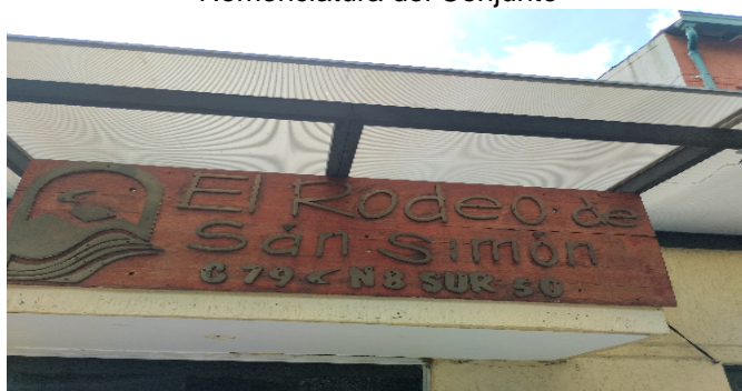
Nomenclatura del Conjunto