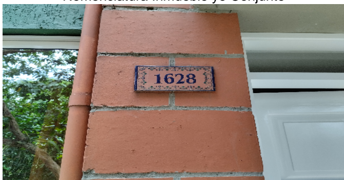
Nomenclatura Inmueble y Conjunto