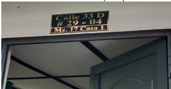
Nomenclatura Inmueble yo Conjunto