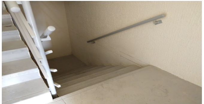
Escalera comn CJ