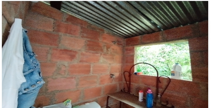
Detalle de acabados