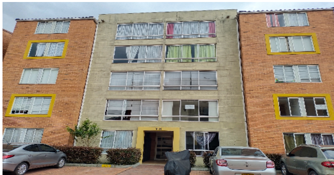
Fachada de la torre