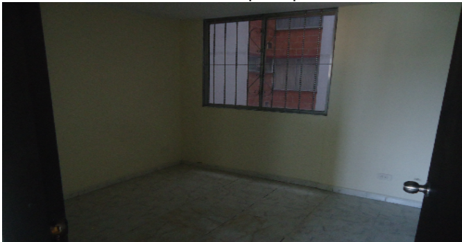
Puerta Hab principal