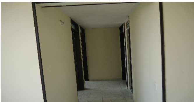
Hall o Estar de Habitaciones