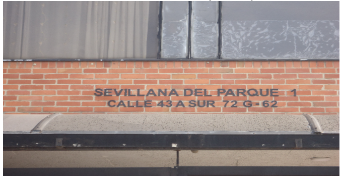
Nomenclatura Inmueble yo Conjunto