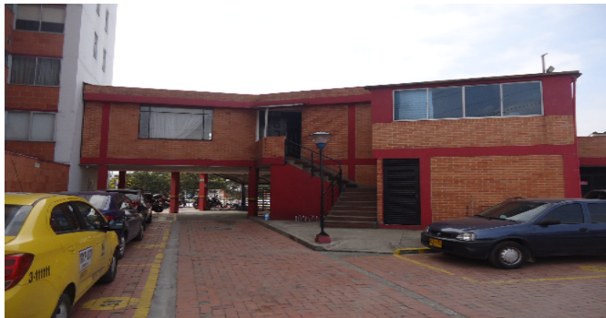
Otras Zonas SocialesCJ