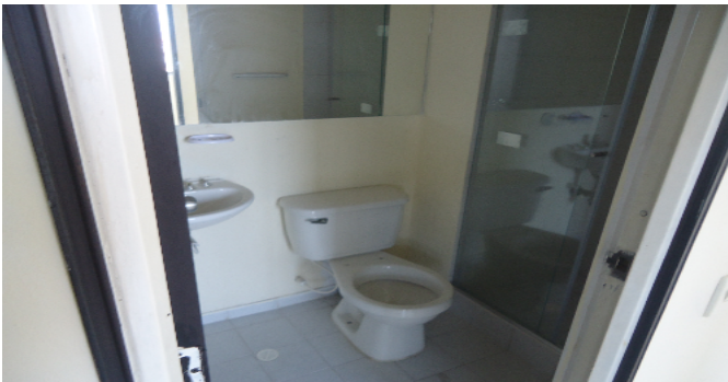
Baño Social 1