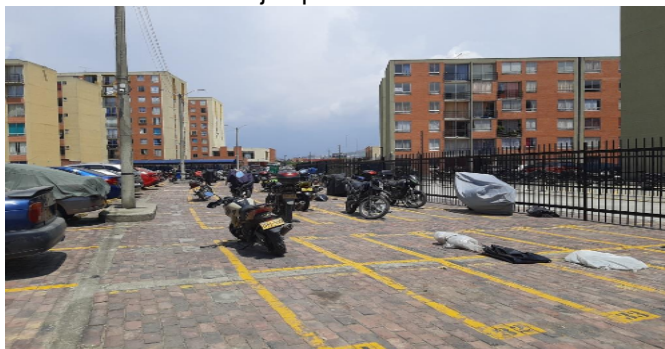
Garajes para motos-CJ