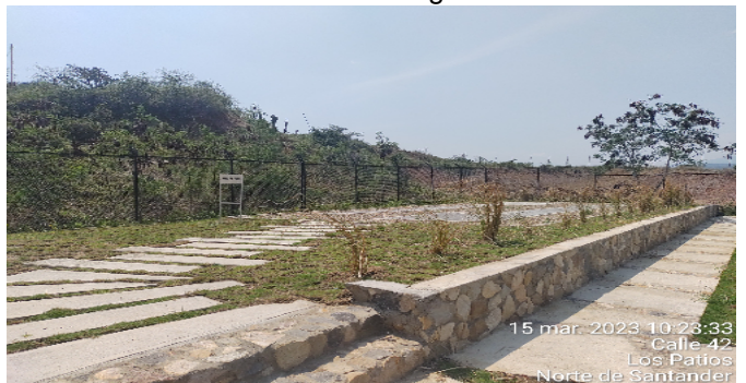
Area de Yoga