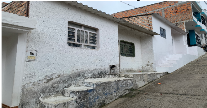
Vista Inmueble Contiguo