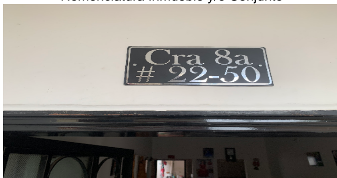
Nomenclatura Inmueble y/o Conjunto