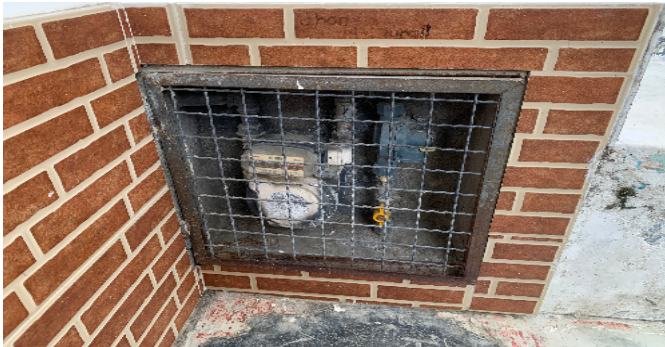
Contador de Gas