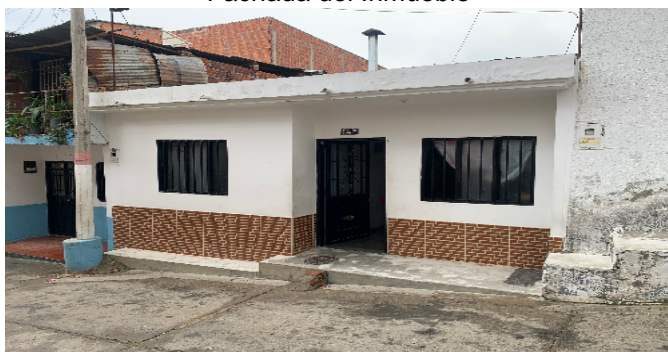
Fachada del Inmueble