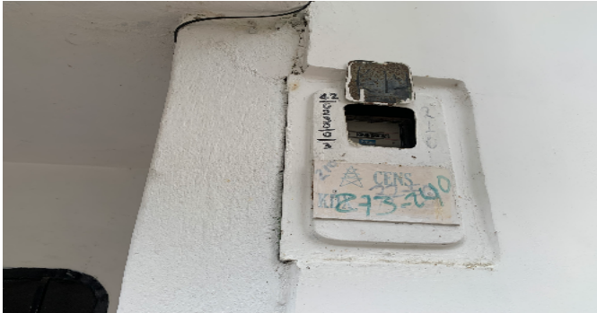
Contador de Energia