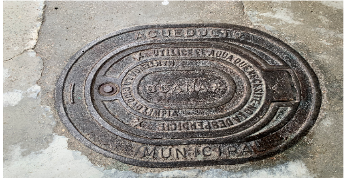
Contador de Agua