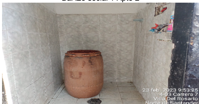
Baño social 1 Apto 2