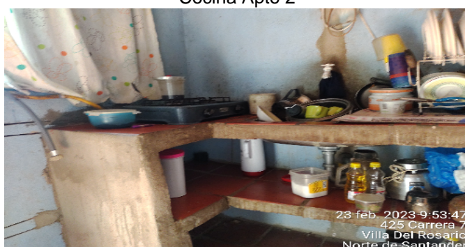
Cocina Apto 2