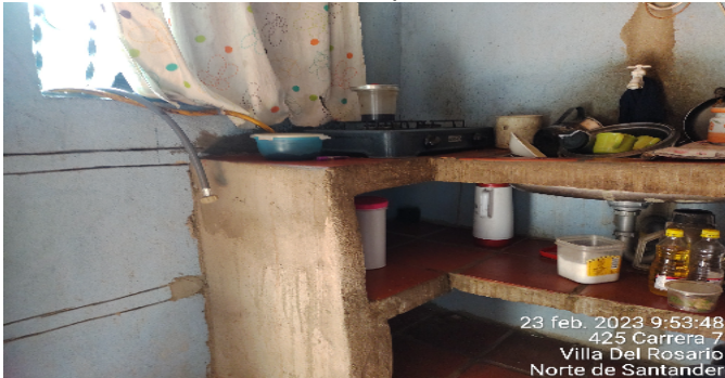
Cocina Apto 2