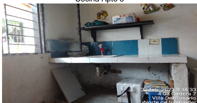
Cocina Apto 3