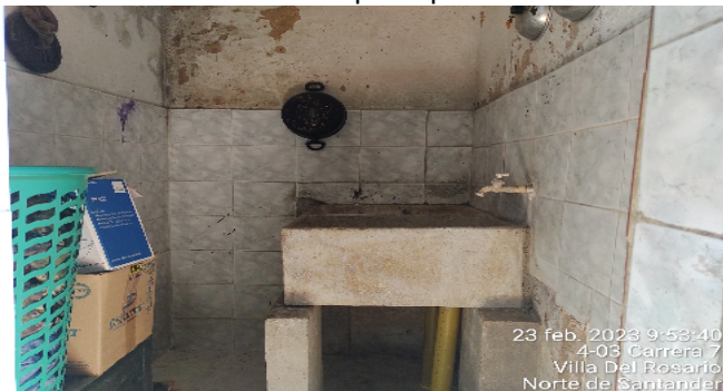
Zona de ropas Apto 2