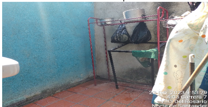
Patio interior Apto 2