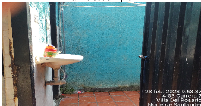
Baño social Apto 2