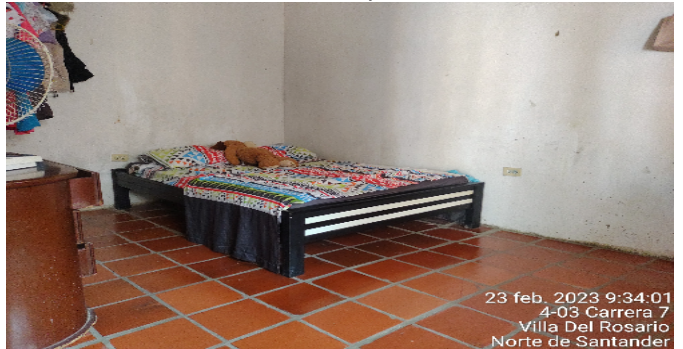
Alcoba 1 Apto 93