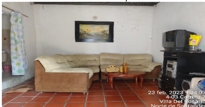
Sala Comedor Apto 3