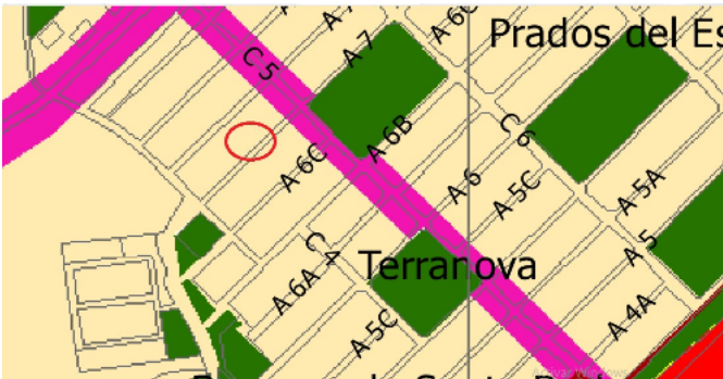
Plano de usos