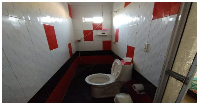
Baño Social 2