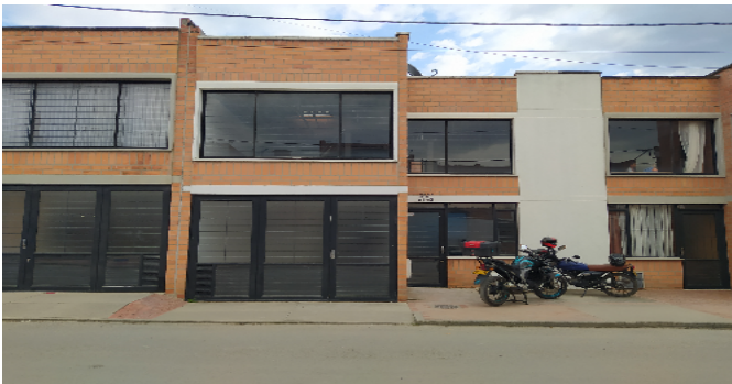
Fachada del Inmueble