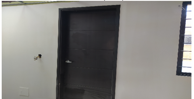
Puerta Hab. principal