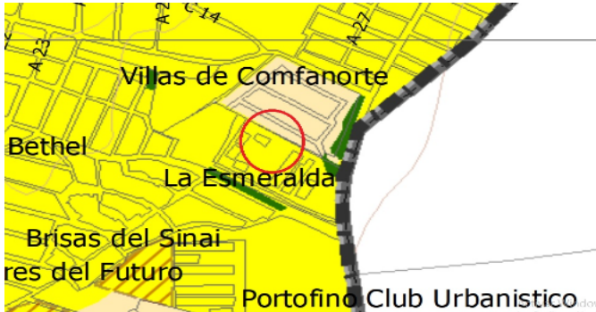
Plano de usos