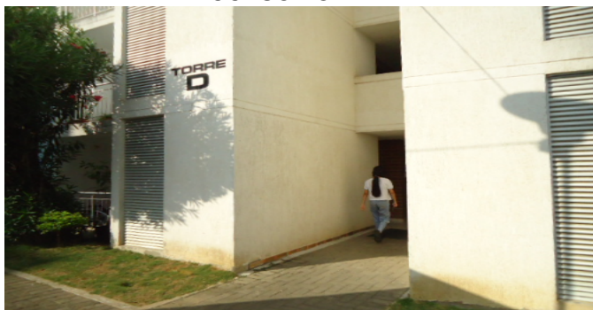
ACCESO TORRE D