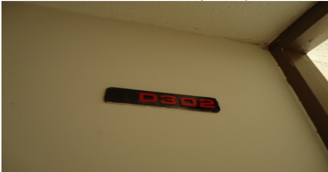
Nomenclatura Inmueble y/o Conjunto