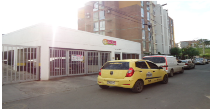
Fachada del Conjunto