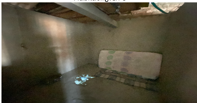
Habitacii ½n 5