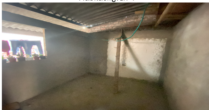
Habitacii ½n 4