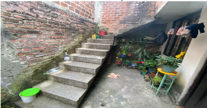
Escalera a 2 piso