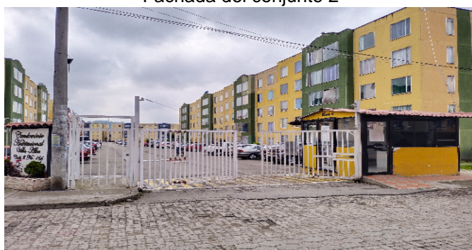
Fachada del conjunto 2