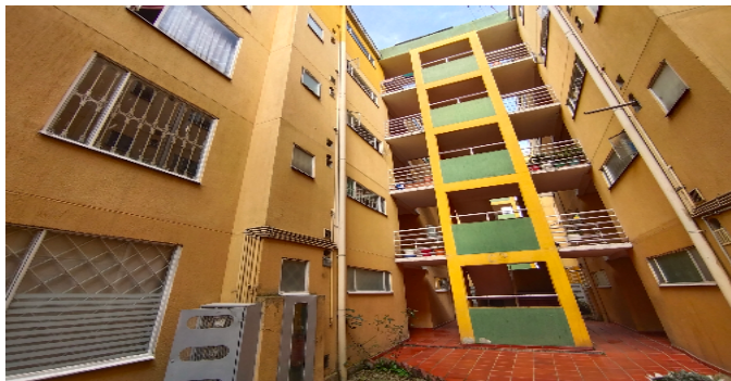
fachada de la torre